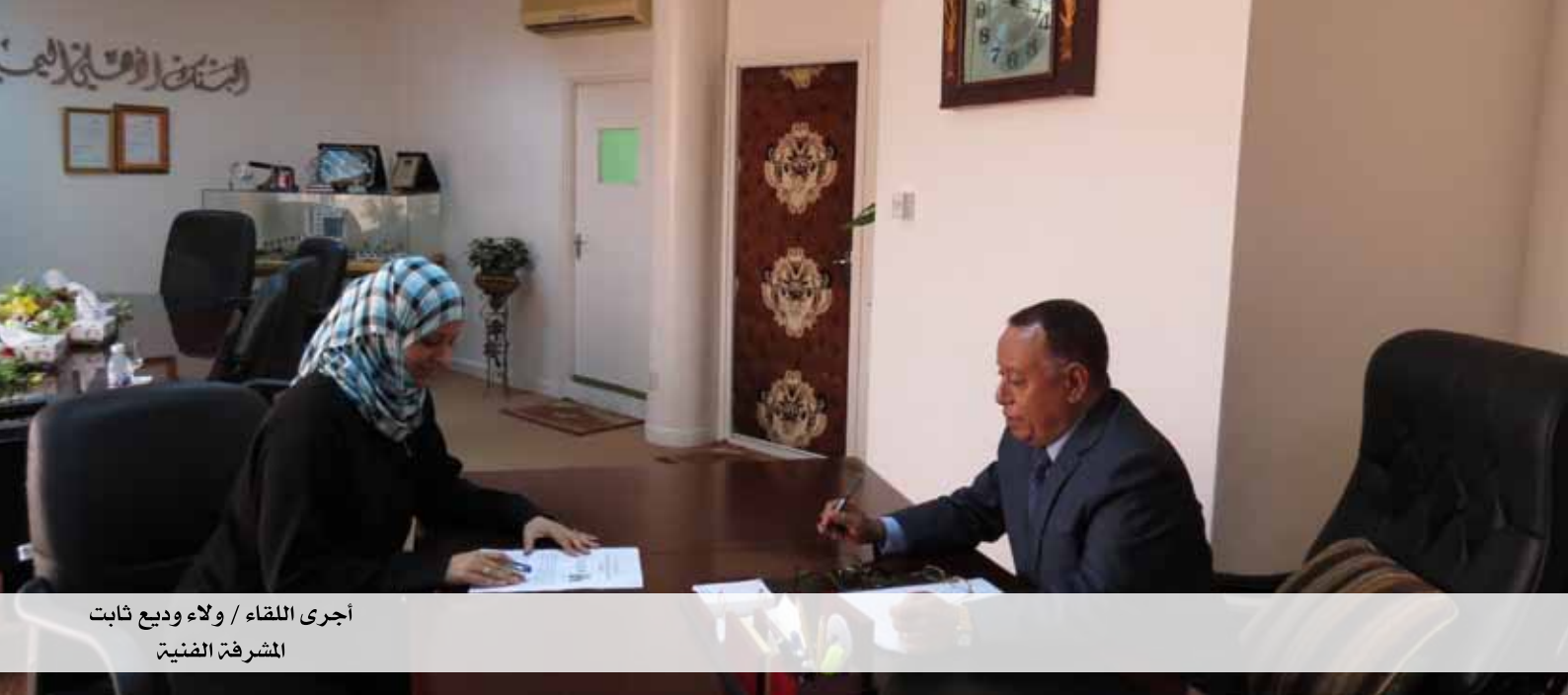
أجرى اللقاء / ولاء وديع ثابت المشرفة الضئيت

الثقة الكاملة للمعلاء والمراسلين في الخارج ويسهل له الاتصال بالمؤسسات المالية الدولية، فقد زارنا مؤخراً وفداً من شركة واري الهندية التابعة لمجموعة العتيبه من دولة الإمارات العربية المتحدة تبادلنا خلالها مع الوفد بعض مشاريعهم الاستثمارية في مجال العقار في اليمن، كما وجهوا إلينا الدعوة لزيارتهم في أبوظبي وفعلاً قمنا مؤخراً بزيارة إمارتي دبي و أبوظبي للالتقاء بمراسلينا من البنوك هناك لبحث وتطوير العلاقات معهم، كما زرنا مجموعة العتيبه وكذلك مؤسسة برنامج تمويل التجارة العربية التابع لصندوق النقد العربي ووقعنا معهم مذكرة تفاهم بين البرنامج والبنك بحيث يكون البنك الأهلي اليمني وكالة وطنية لبرنامج تمويل التجارة العربية في اليمن وهذه الاتفاقية تعطي البنك دوراً هاماً في تشييط التبادل التجاري بين اليمن والدول العربية الأخرى استيراداً وتصديراً حيث كان يلعب هذا الدور تجار عرب آخرون نيابة عن التجار اليمنيين وهذا ما أشاروا به