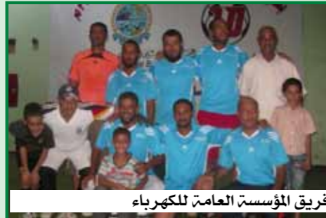
فريق المؤسسة العامة للكهرباء