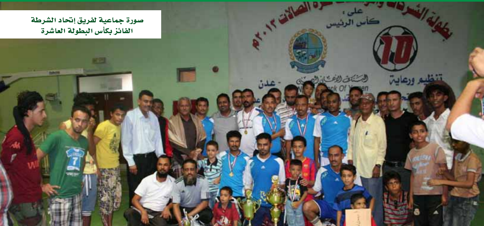
صورة جماعية لفريق اتحاد الشرطة الفائز بكأس البطولة العاشرة

صحيفة الرياضية صحيفة الأمان وكالة سبا صحيفة اليمن اليوم موقع يمن سبورت صحيفة الشارع