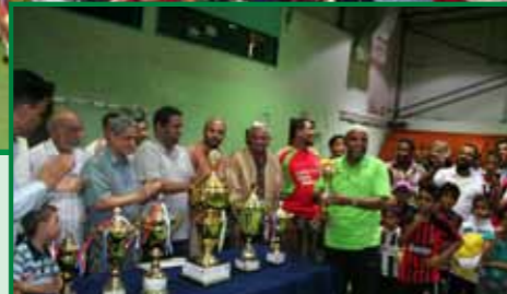
تكريم اللاعب الأكبر سناً في البطولة ( الشركة العربية للحديد والصلب)