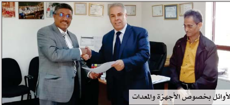
وأثناء توقيع الاتفاقية مع شركة الأوائل بخصوص الأجهزة والمعدات