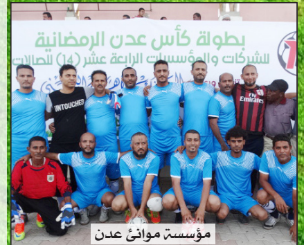
مؤسسة موانئ عدن