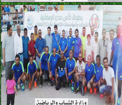
وزارة الشباب والرياضة