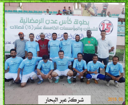
شركة عبر البحار