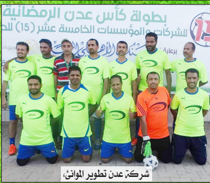
شركة عدن تطوير الموانئ