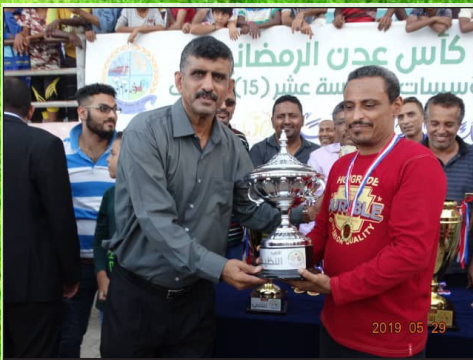
كأس اللعب التنظيف لفريق عبر البحار

النسخة الخامسة عشرة من هذه البطولة التي شهدت هذه المرة تنافساً كبيراً بين الفرق المشاركة ، وجاء تأهل الفريقين للعرس الختامي للبطولة بعد أن تغلب فريق مؤسسة السراي على شركة عدن لتطوير الموانئ بركلات الترجيح في اللقاء الأول من نصف النهائي ، بينما استحق فريق صندوق النظافة مرافقة فريق السراي على إثر فوزه الكبير في مباراة نصف النهائي الثاني على فريق جامعة عدن.