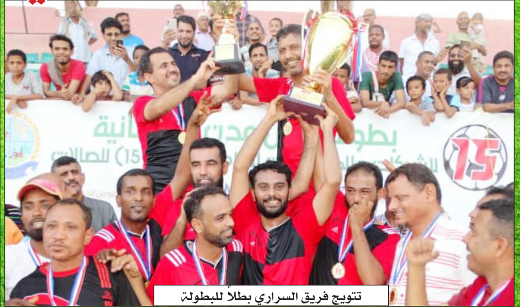
تتويج فريق السراي بطلاً للبطولة