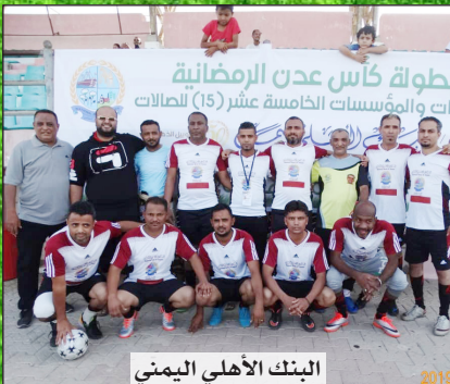
البنك الأهلي اليمني