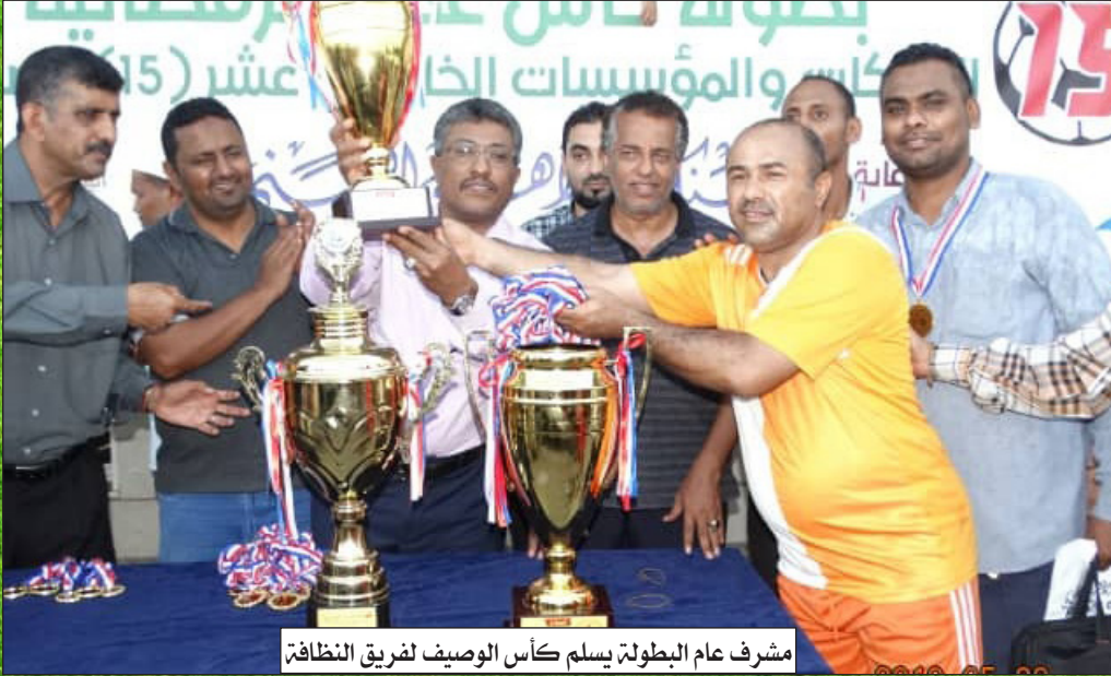
مشرف عام البطولة يسلم كأس الوصيف لفريق النظافة