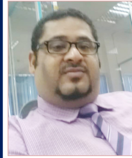
بقلم وضاح سالم باحشوان

تظن أن هذا النجاح الدراسي له علاقة بالذكاء، بل يجب أن تعلم أنك وصلت لهذا المستوى المرتفع دراسياً بسبب اجتهادك، وليس بسبب ذكائك. فالذكاء لا يظهر سوى في كيفية تصرفك في المواقف التي تتعرض لها، وعند التفكير في تنفيذ مخطط معين فقط ولكن بالنسبة للدراسة، فالأمر يتعلق بمدى الجهد العقلي الذي تبذله، وليس مستوى الذكاء الذي تتمتع به.