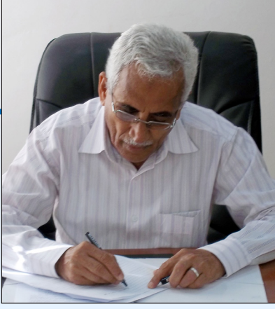
بقلم/ علي منصور ماطر رئيس التحرير