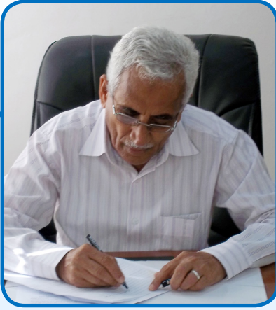
بقلم/ علي منصور ماطر رئيس التحرير