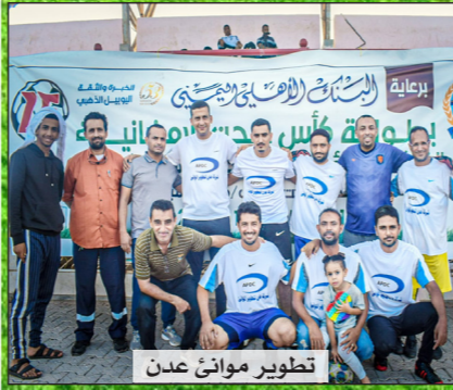
تطوير موانئ عدن