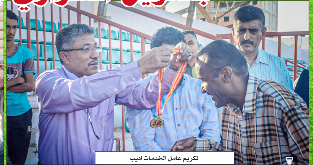
تكريم عامل الخدمات ادبي