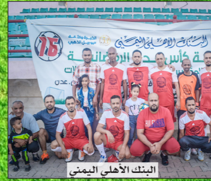
البنك الأهلي اليمني