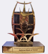
جائزة التميز والإنجاز المصرفي العربي لكفاءته وتميزه للعام 2020-2021