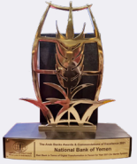
جائزة التميز والإنجاز المصرفي العربي لكفاءة وتميزه للعام 2020-2021