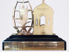
جائزة كأفضل بنك في اليمن 2022