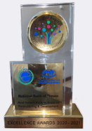
جائزة التميز للعام 2020-2021