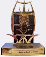
جائزة التميّز والإنجاز المصرفي العربي لكفاءته ونميّزه للعام 2020-2021