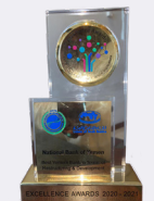
جائزة التميز للعام 2020-2021