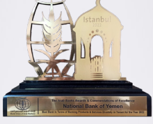
جائزة كأفضل بنك في اليمن 2022