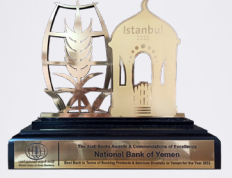
جائزة كأفضل بنك في اليمن 2022

أعرق البنوك في الجزيرة العربية (53 عاماً من العمل المالي والمصرفي)