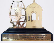
جائزة كأفضل بنك في اليمن 2022