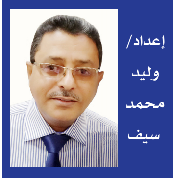
إعداد/ وليد محمد سيف

دائرة العلاقات الخارجية بزيارة عمل ناجحة للبنوك المراسلة في كل من عمان ومسقط وذلك ضمن عملية تطوير العلاقات