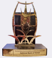
جائزة التميز والإنجاز المصرفي العربي لكفاءته وتميزه للعام 2020-2021