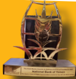
جائزة التميّز والإنجاز المصرفي العربي للعام 2020 - 2021 لكفاءته وتميّزه