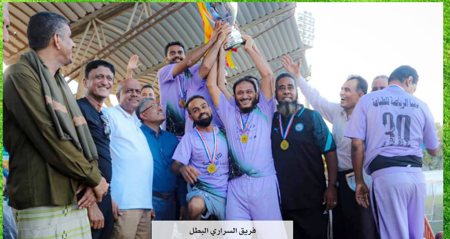
فريق السراري البطل