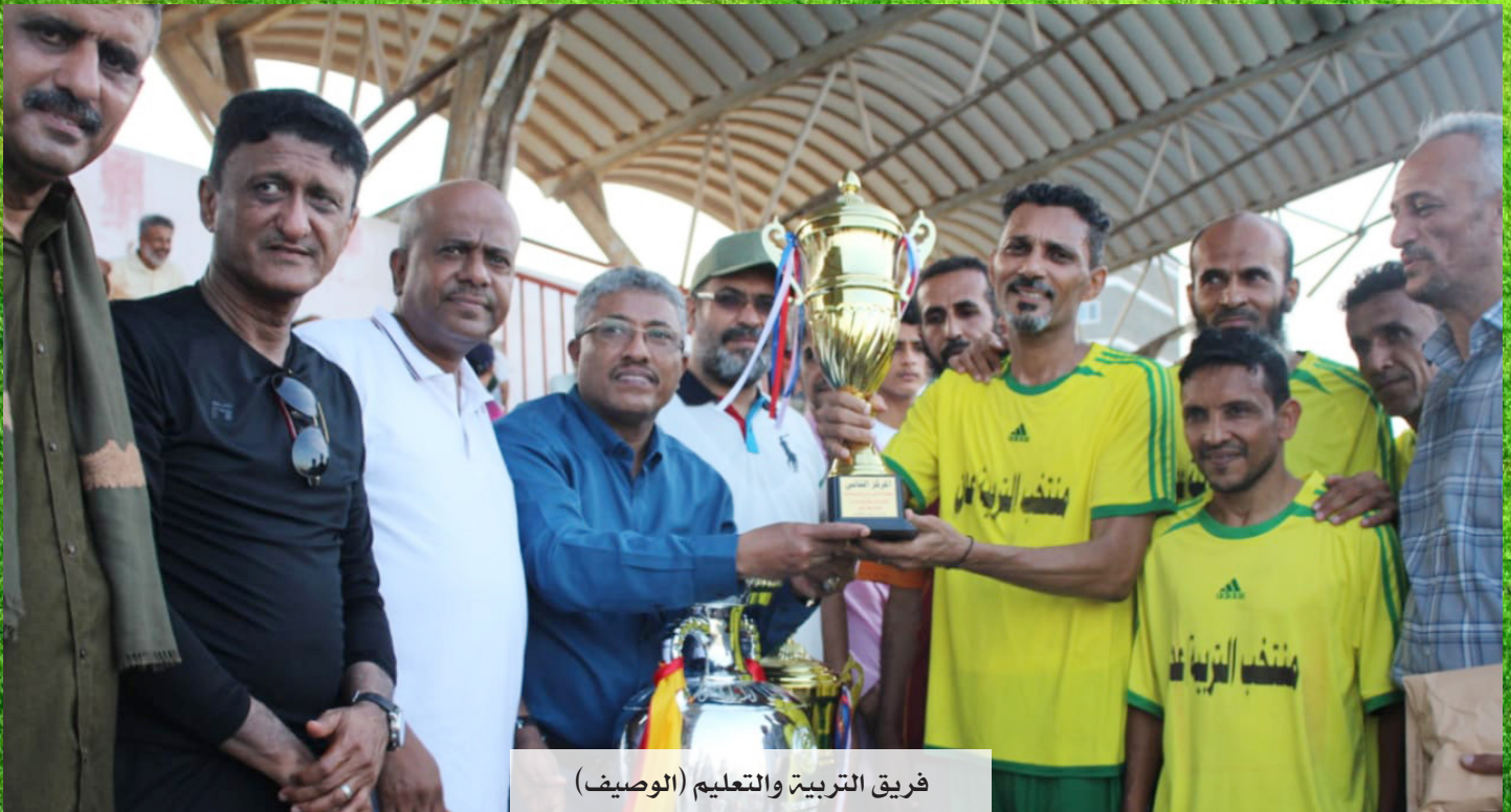
فريق التربية والتعليم (الوصيف)

الأربع على النحو التالي: ❖ المجموعة الأولى :