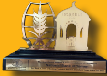
جائزة كأفضل بنك في اليمن 2022