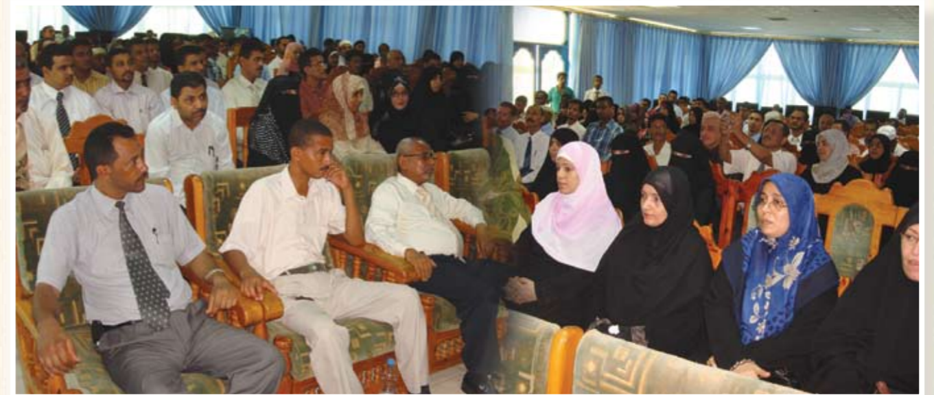
جانبا من الحضور (المكرمون)