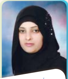
إعداد/ ولاء وديع ثابت