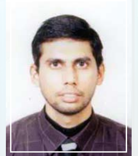
إعداد / حسين عبدالرزاق أحمد فني بوحدة المطبوعات والقرطاسية

(١) الأمان:- تشكل النقدية في البنوك العنصر الهام في نشاط البنوك وتعتبر النقود من أكثر الأصول تعرضاً للسرقة والاختلاس، لذلك يجب أن يضمن النظام منع الخسارة والسرقة والخطأ من خلال مجموعة من الضوابط التي تحققها الرقابة الداخلية. (٢) الدقة:- الدقة عامل له خصوصيته في